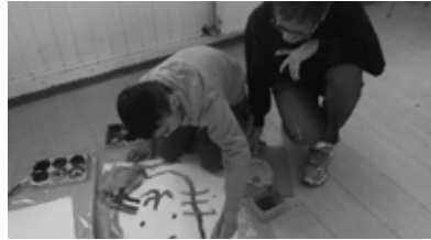
Impressionen des Mal- und Bastelangebots