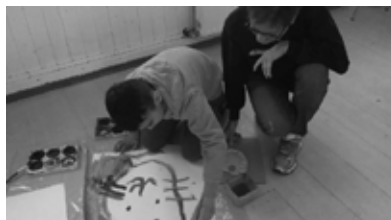
Impressionen des Mal- und Bastelangebots